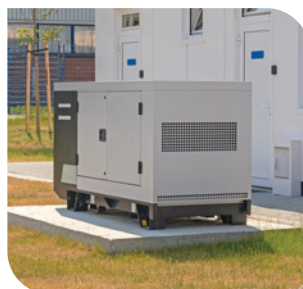
レンタル・リース